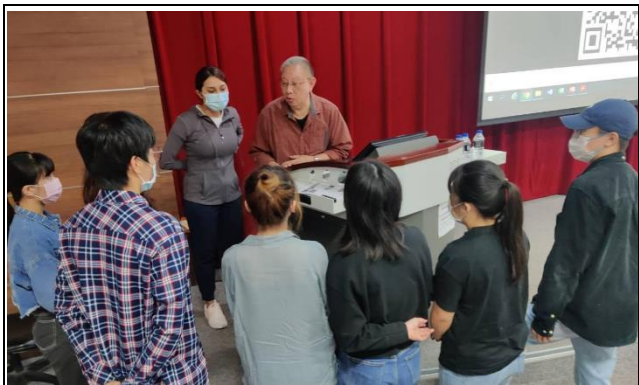
會後同學請教新加坡工作實習問題