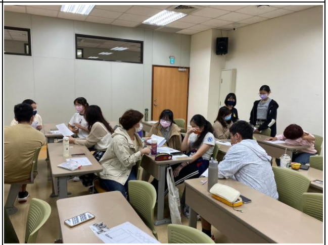
同學互相討論情形