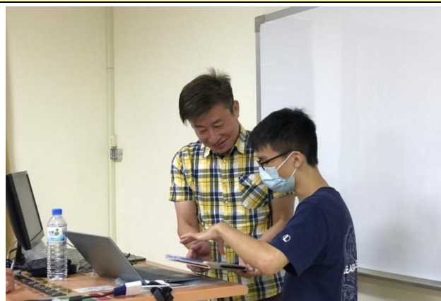
同學向老師請教情形