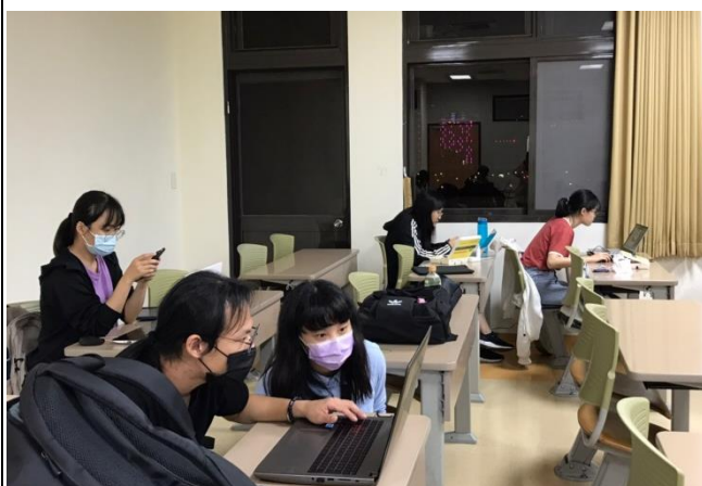
同學製作貼圖情形