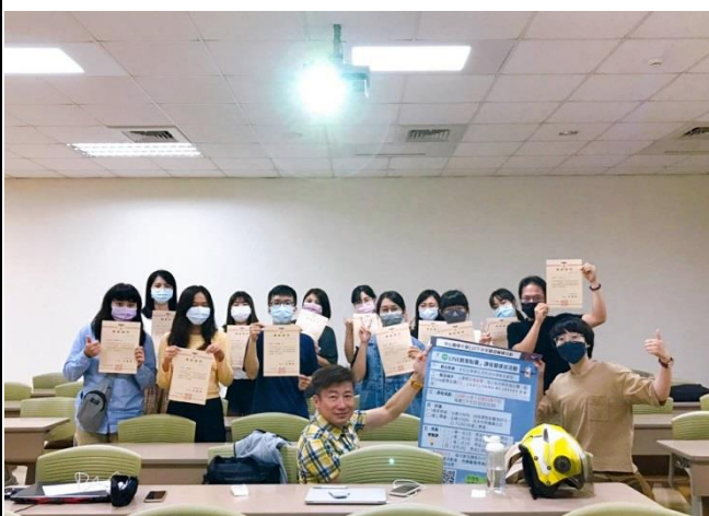
頒發課程證明書及大合照