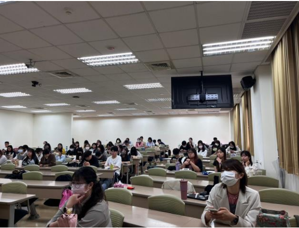
現場同學專心聽講