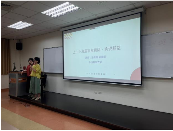
主持人開場講者分享