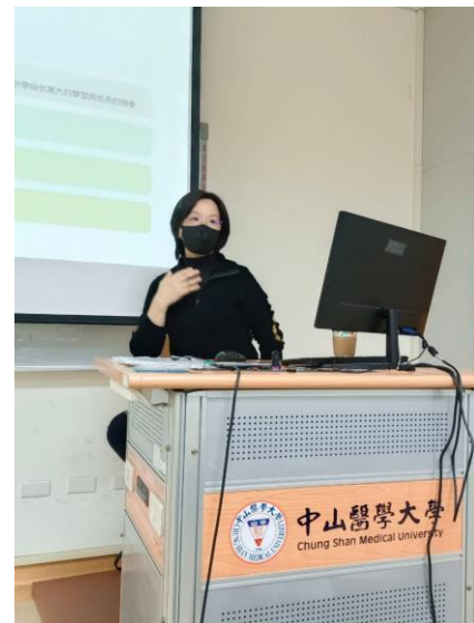
講者分享心路歷程