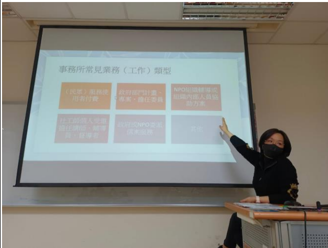
講者說明事務所業務