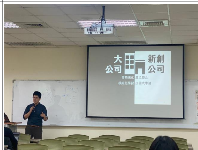
講師分享相關資源