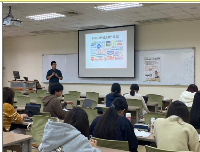
講師講述各產業面向