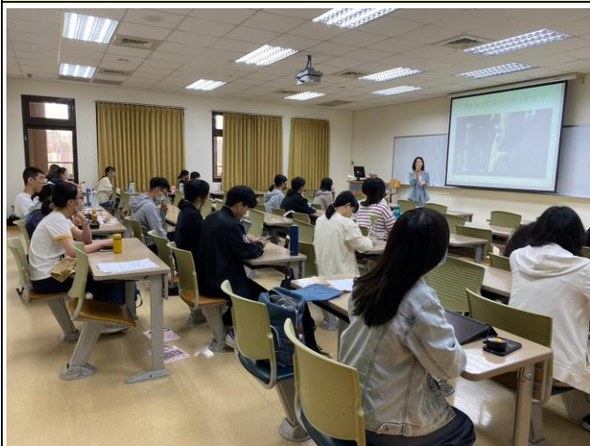
老師介紹活動內容