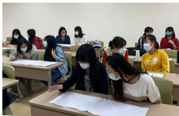
自信力雷達圖分組回饋