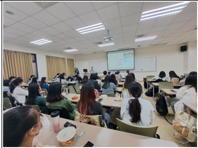
講師分享應屆同學職涯方向