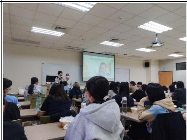
老師回饋及自身經驗分享