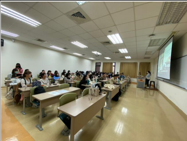
講師以護理師及家長身分分享對護理的看法