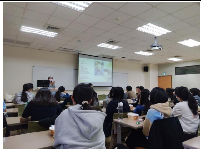
講師照顧血癌兒童之經歷分享