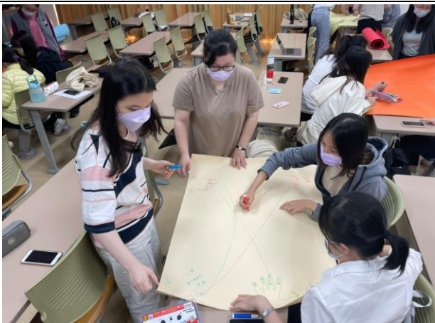
小組活動討論情形