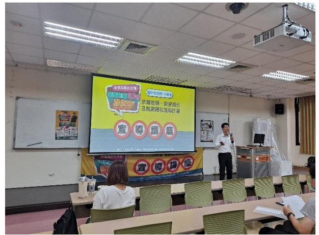
講師說明宣導用意