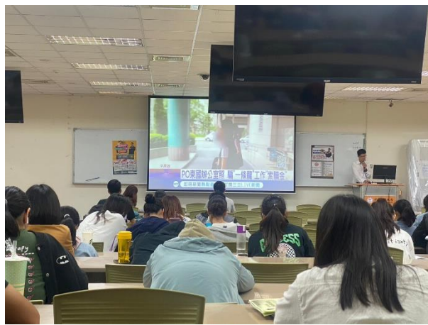
律師講述新聞案例