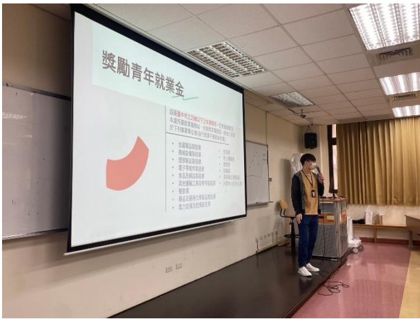
台中市就業服務處宣導就業資源