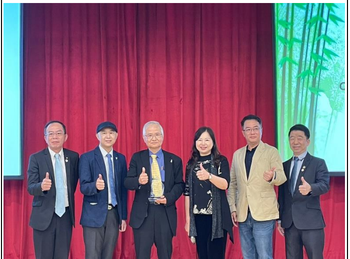
學務長與主講人及參加校友大合照