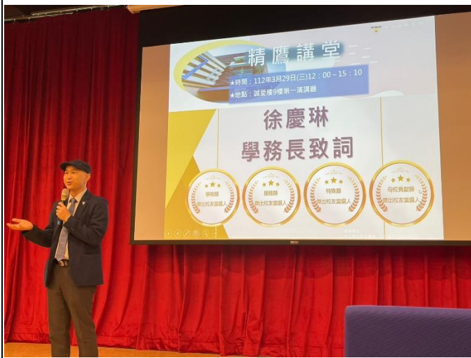
精鷹講堂學務長致詞