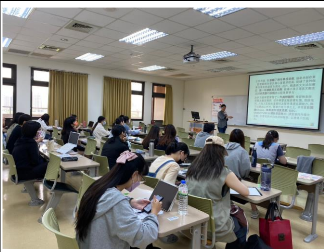
講師講述履歷呈現技巧