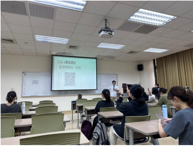
給學弟妹的一封信