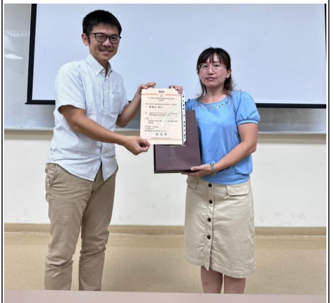
致贈感謝狀及紀念品