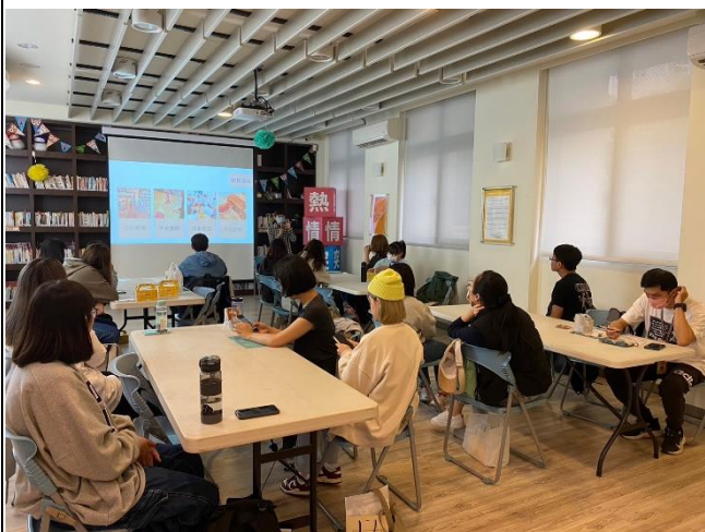
講師講述工作室歷程