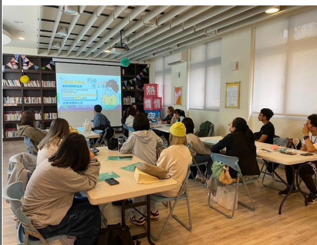
中心人員介紹青年職涯發展中心相關資源