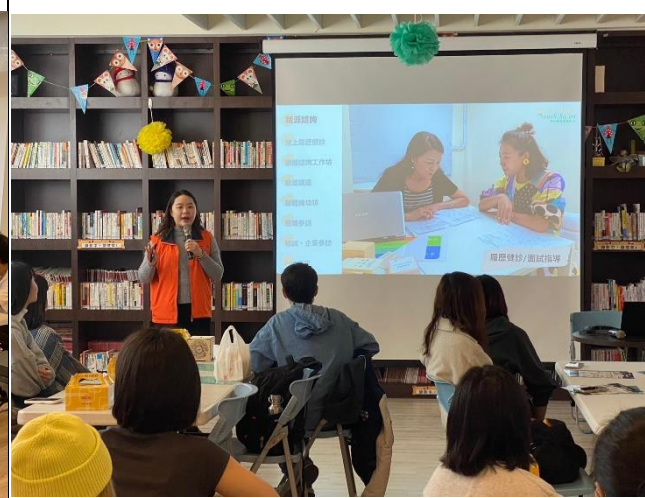
中心人員介紹青年職涯發展中心相關資源