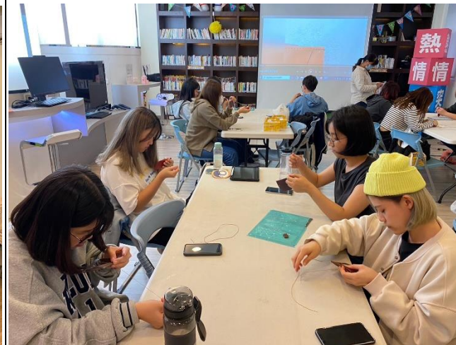
學生體驗手作識別證