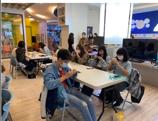
學生體驗手作識別證