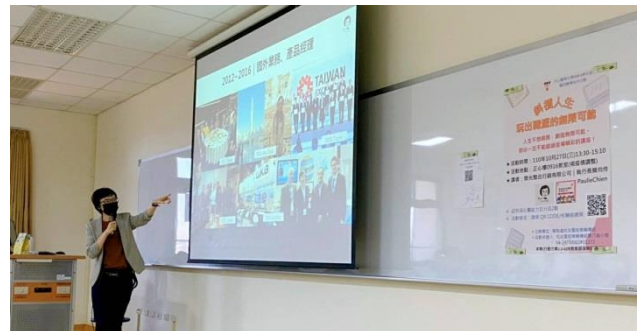
講師講述自身經歷