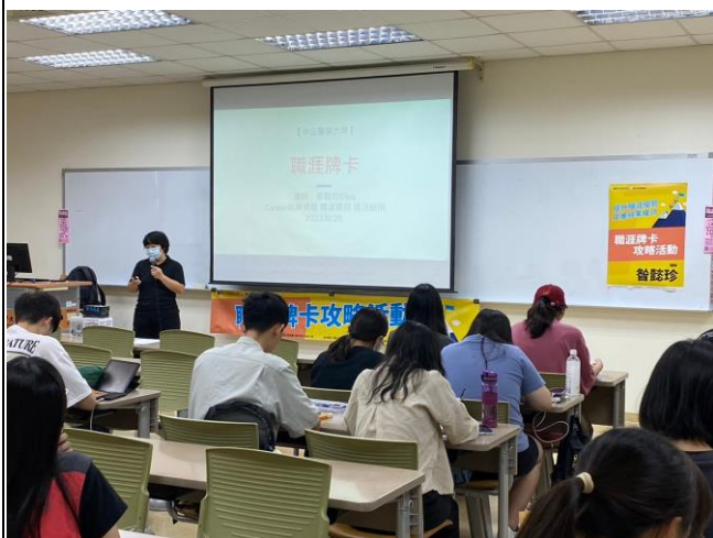
講師介紹職涯牌卡