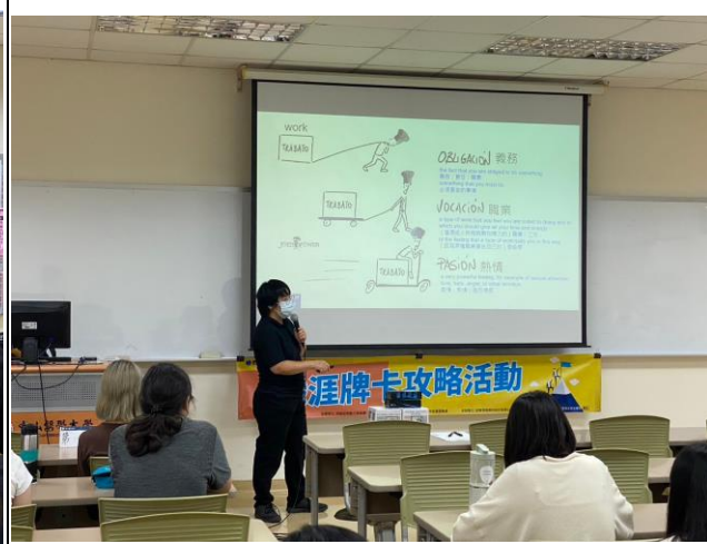
講師講述職涯歷程