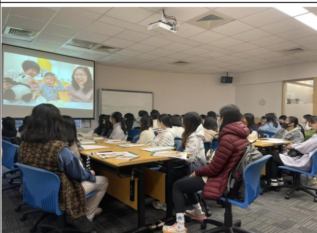
同學們皆專心觀看雅文基金會所準備之企業理念介紹影片