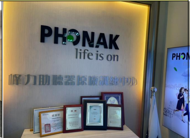
這次活動之第二個參訪企業—峰力助聽器原廠訓練中心