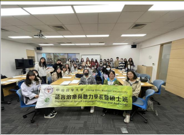
這次活動之第一個參訪企業—雅文基金會