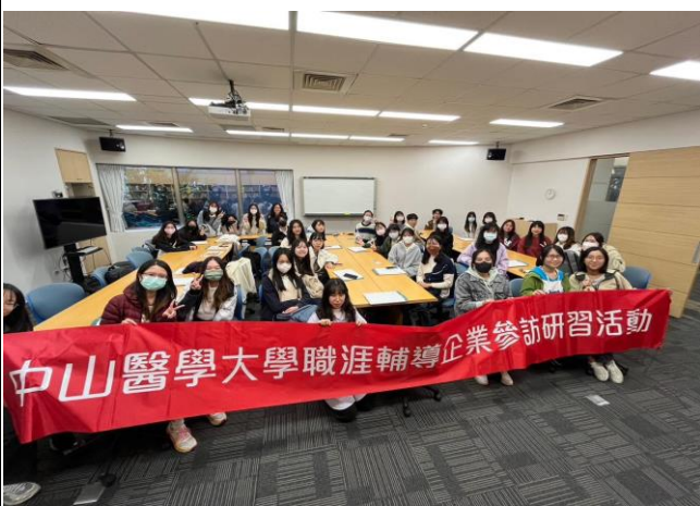
活動參與學生於雅文基金會合照 2