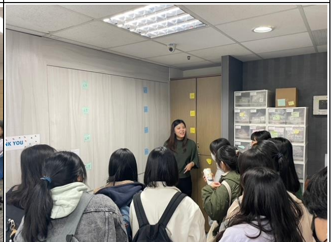
助聽器之簡單實作課程