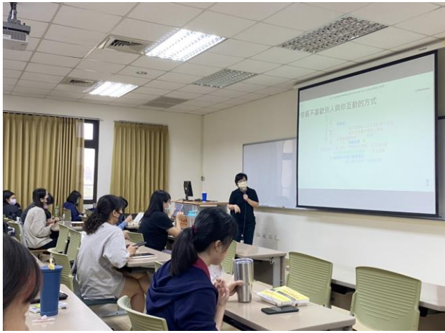
講師講授人際互動理論