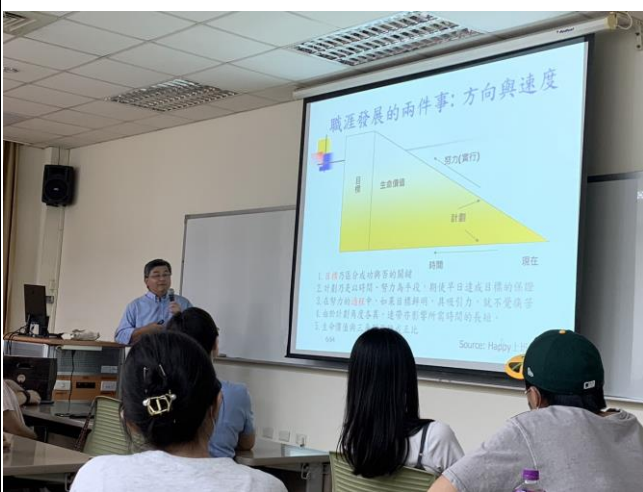
講師分享人生職涯規劃與經驗