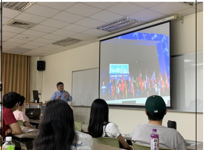
講師分享代表台灣站上世界舞台