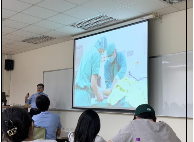
講師分享手術室臨床經驗