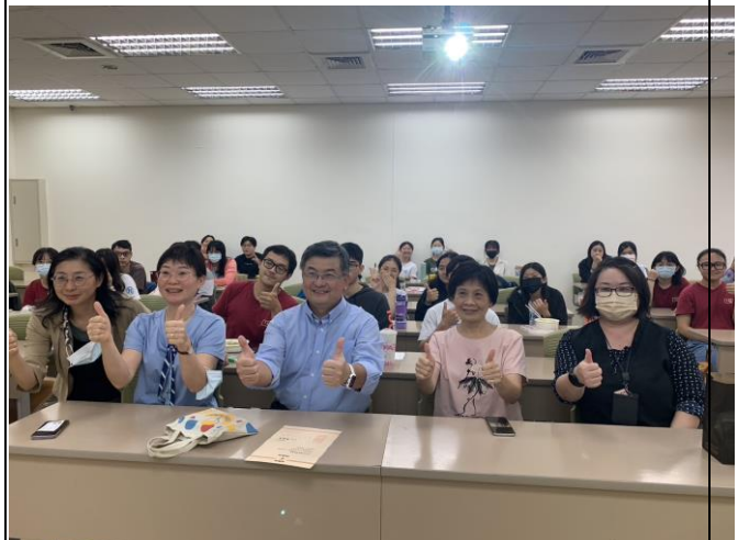
男丁格爾職涯分享講座圓滿成功