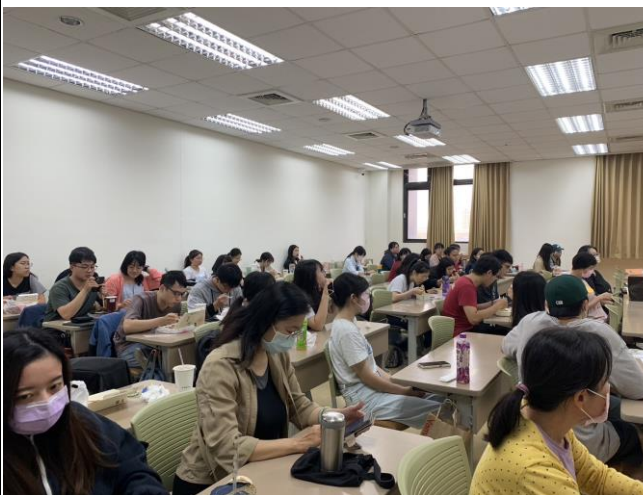
台下學生認真聽演講