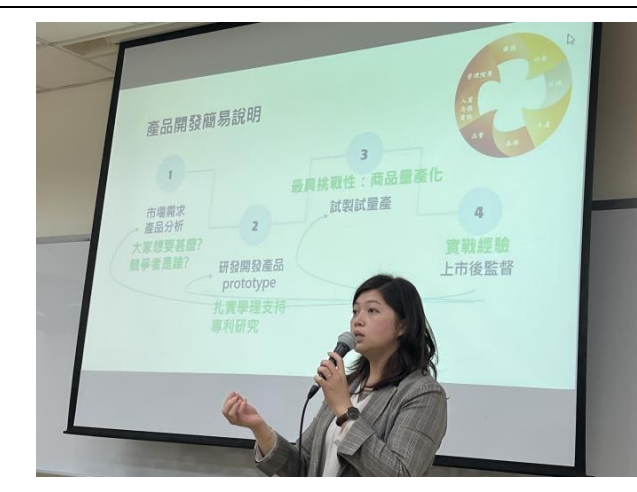
講者說明產品開發應用