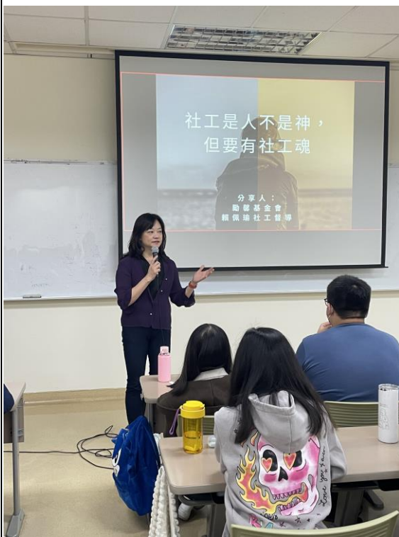
系主任開場介紹講師