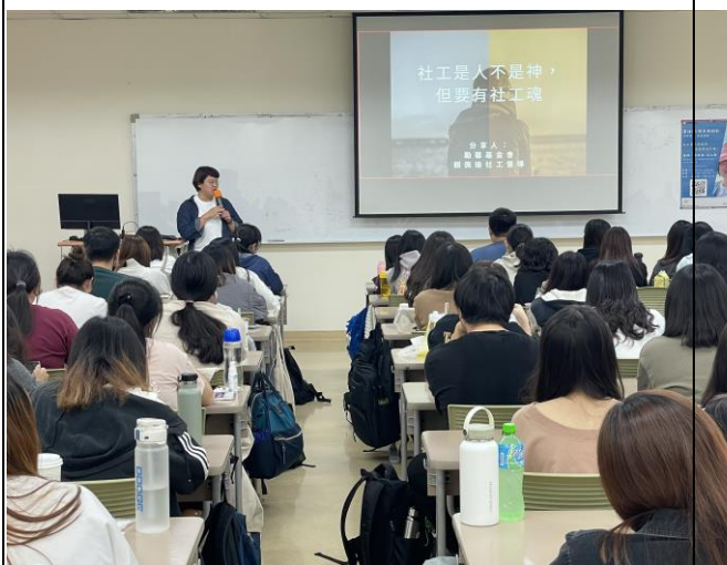
主任致贈講師感謝狀