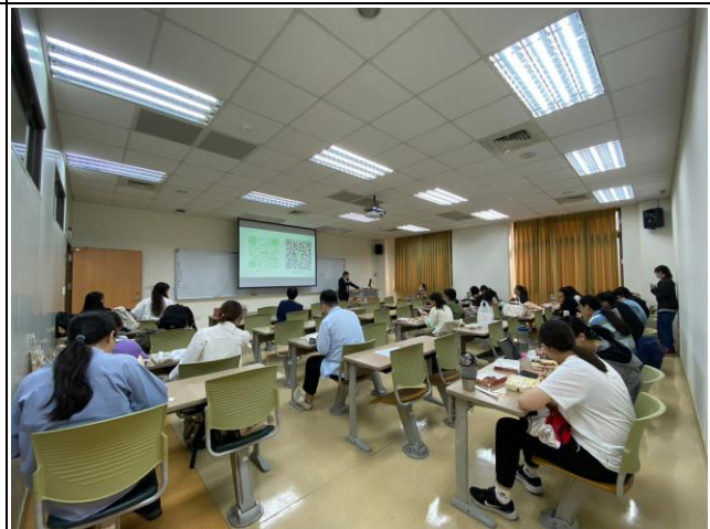
講師與底下同學之互動