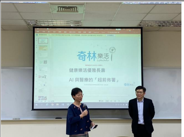
主任對演講進行開場白