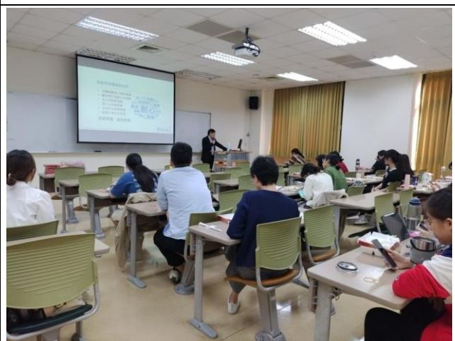
講師分享應屆同學們的職涯方向