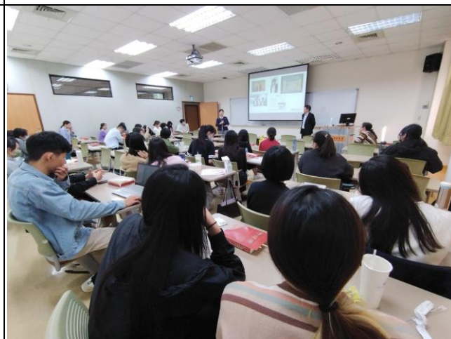
主任回饋及自身經驗分享