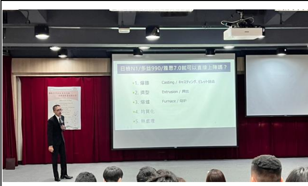
講解語言能力標準