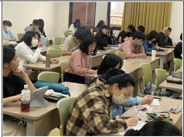
同學思考紀錄情形