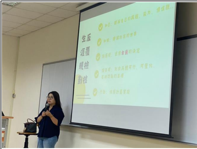
講師講述生涯規劃檢核