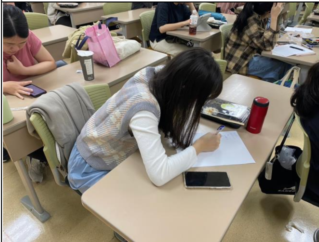
同學思考紀錄情形