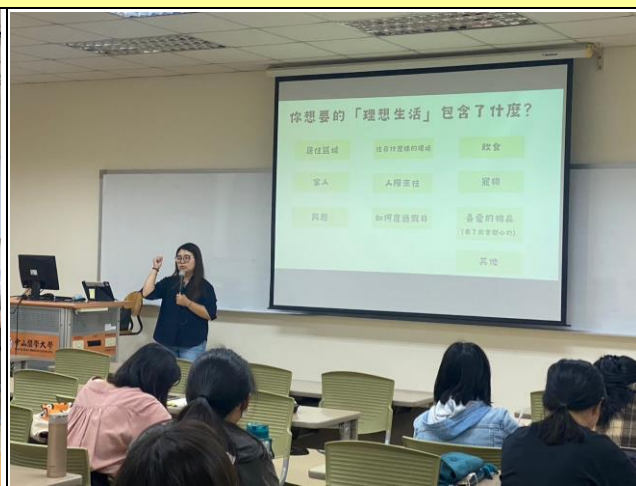
講師講述生理想生活與工作