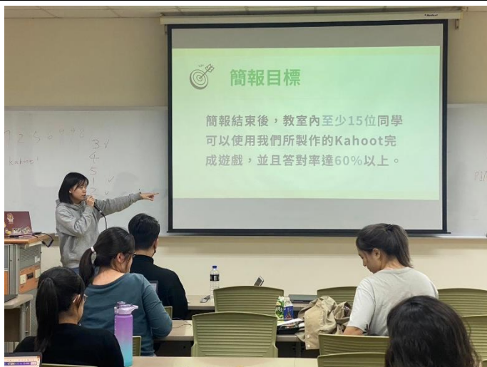
小組上台簡報情形