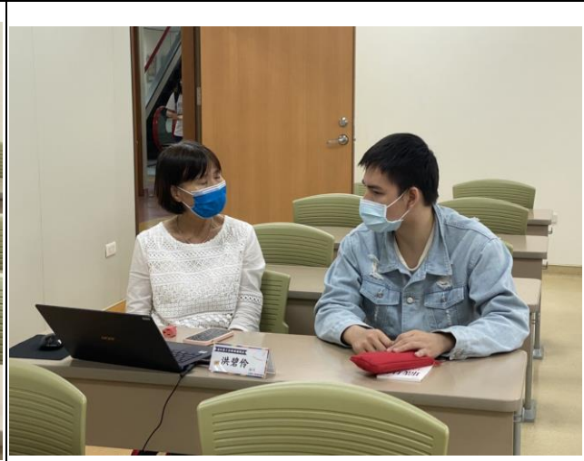
學生與顧問診諮詢情形