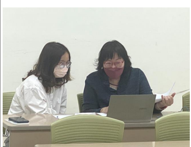
學生與顧問診諮詢情形