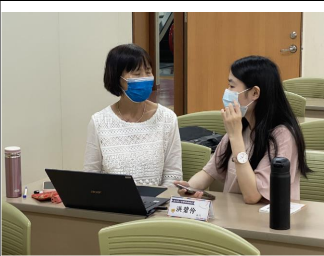
學生與顧問診諮詢情形