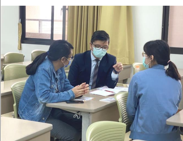
學生與就業情報總監諮詢情形