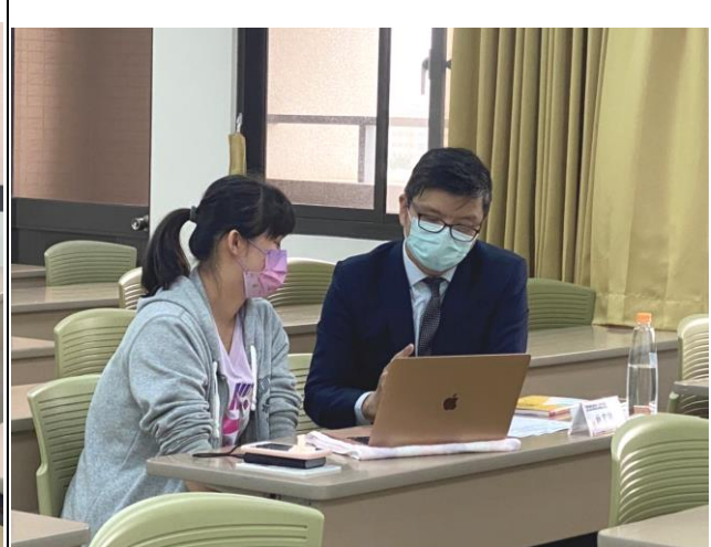
學生與就業情報總監諮詢情形