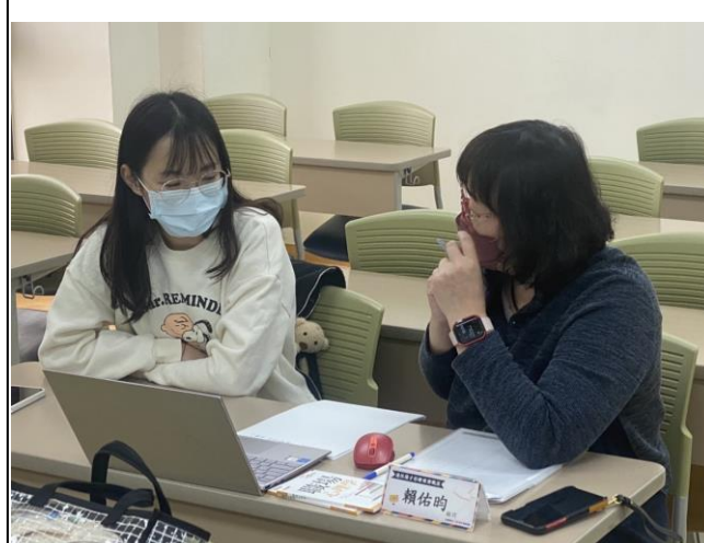
學生與顧問診諮詢情形