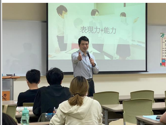
講師與學生互動情形