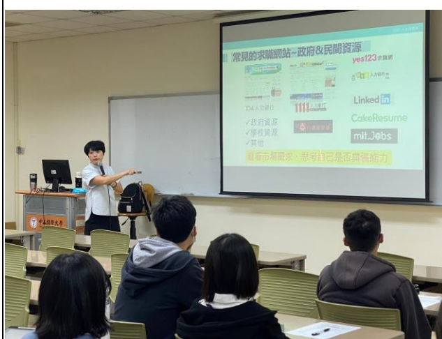
講師分享相關資源