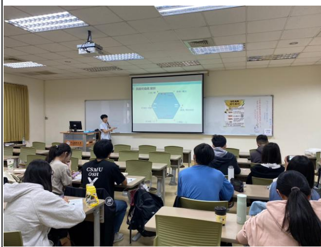
講師講述何倫碼解析