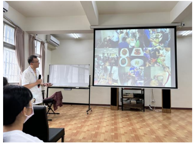
職能治療師介紹業務內容