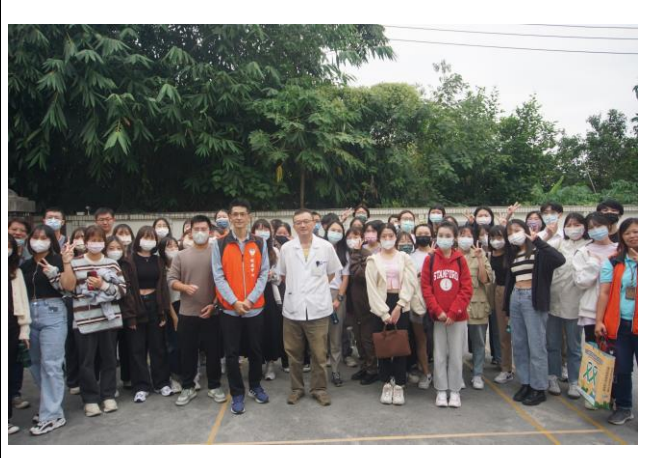
活動後與職能治療師大合照