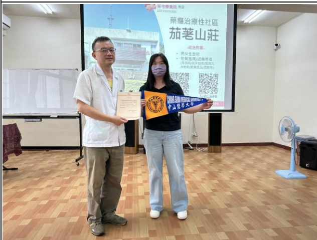
頒發感謝狀與紀念品