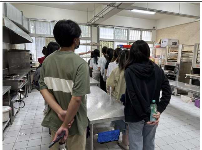
分組實地參訪：烘焙工坊