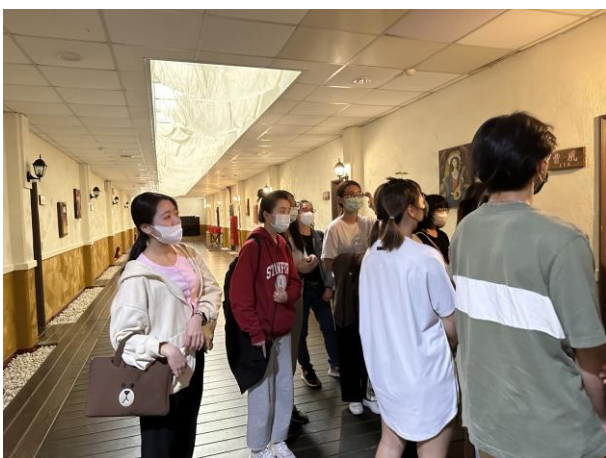
分組實地參訪：住民房間