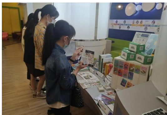
同學自由觀覽中心資源