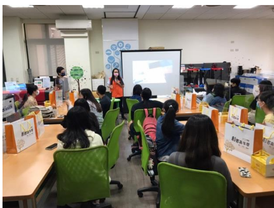
人員介紹青年職涯發展中心