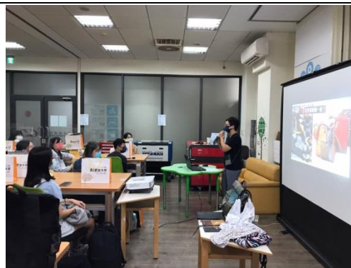
袋代講師講述自我職涯歷程