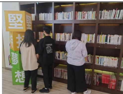
同學自由觀覽中心資源