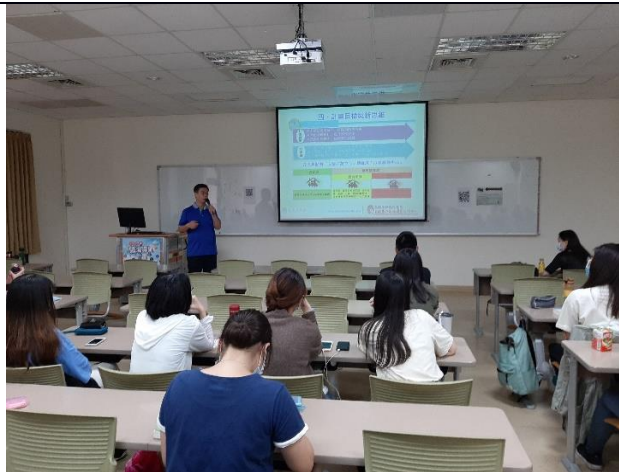
講者文圖並茂的演說