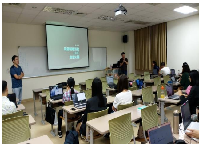
9/25 授課教師與承辦單位說明注意事項