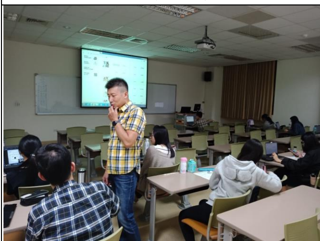
10/23 學生實作與講師指導情形