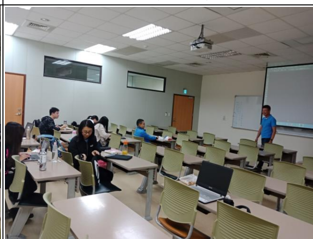
10/30 Q&A 情形