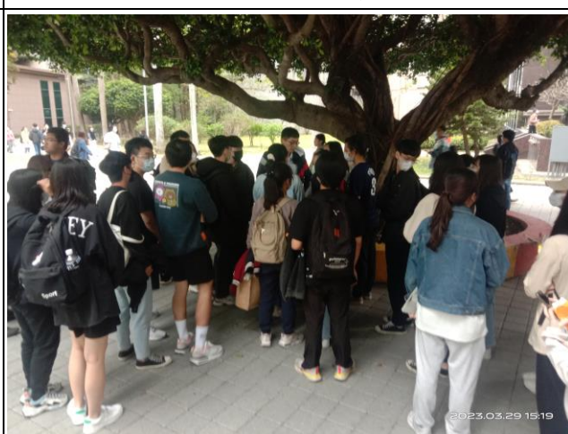
演講結束後同學詢問情況