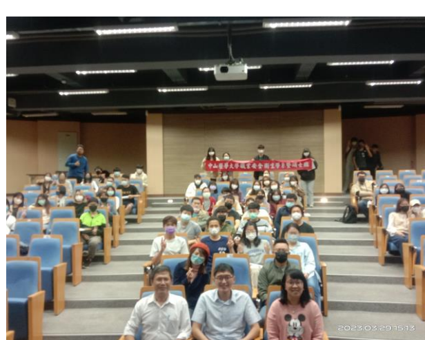
演講者與聽講同學合照