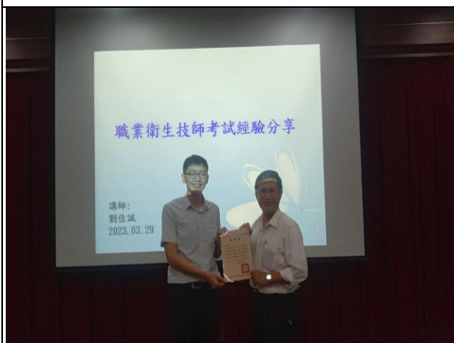
贈送演講者感謝狀