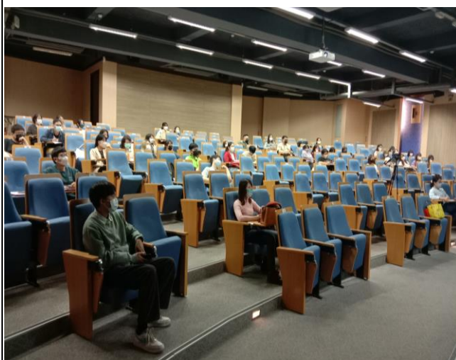
參與學生聽講情形