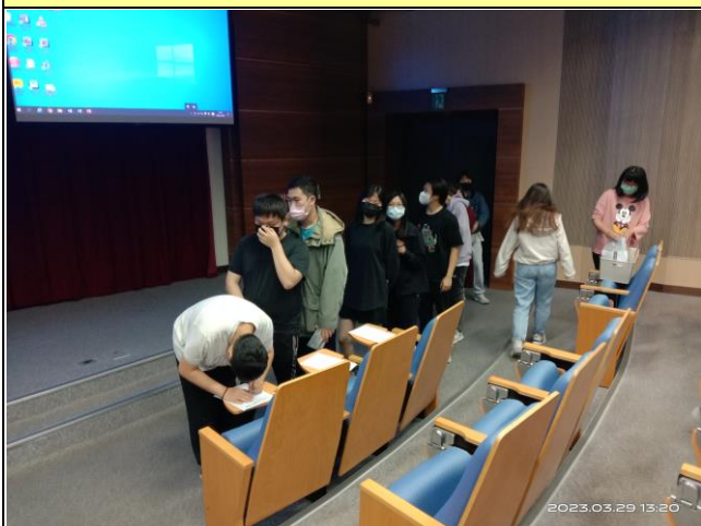
參與學生簽到情形