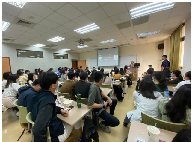
講師回饋及分享自身經驗