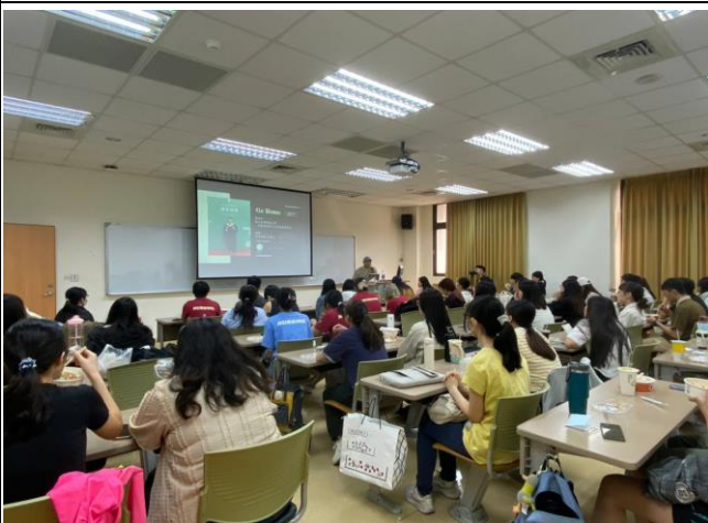
講師分享目標設立規劃