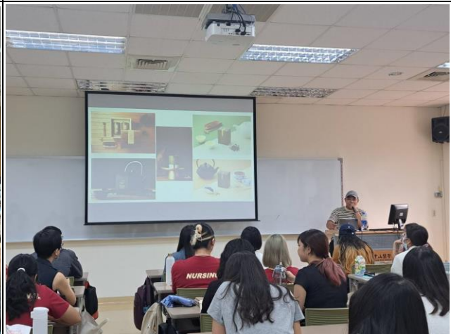
講師分享追求目標過程