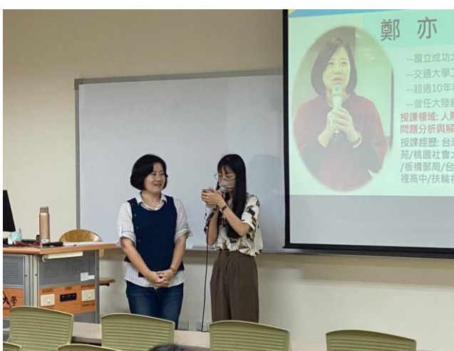
同學與老師互動情形