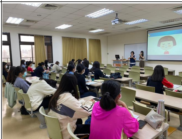
同學與老師互動情形