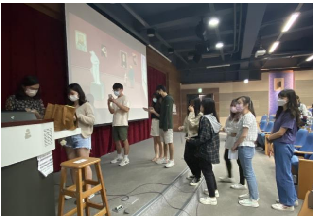
與插畫家拍照簽名時間