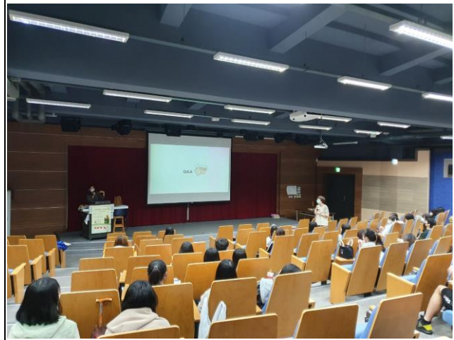
活動 Q&A 時間