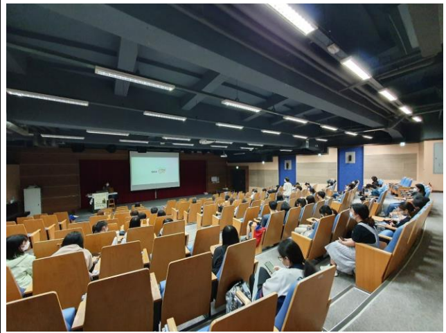
活動 Q&A 時間