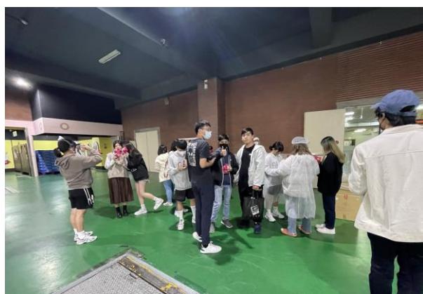
同學開心合影留念