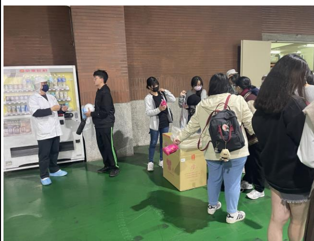
(學生 Q&A 解說)