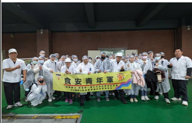
伊莎貝爾企業參訪大合照