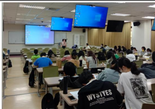
參與學生聽講情形