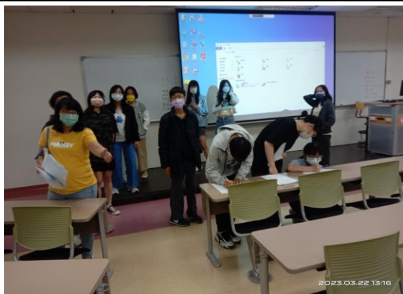
參與學生簽到情形