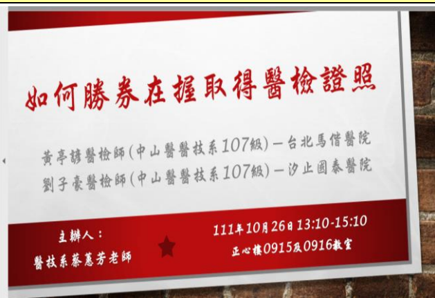
介紹演講者專長及工作領域