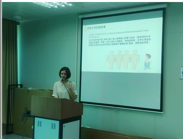
講者介紹青少年服務機構