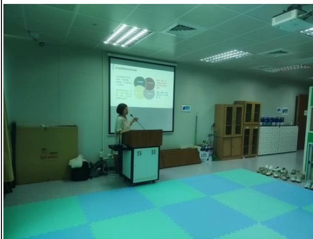
講者說明青少年發展理論