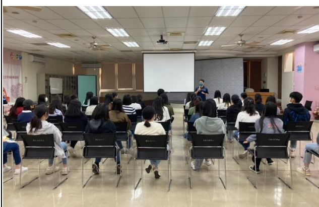
輔具中心督導簡介