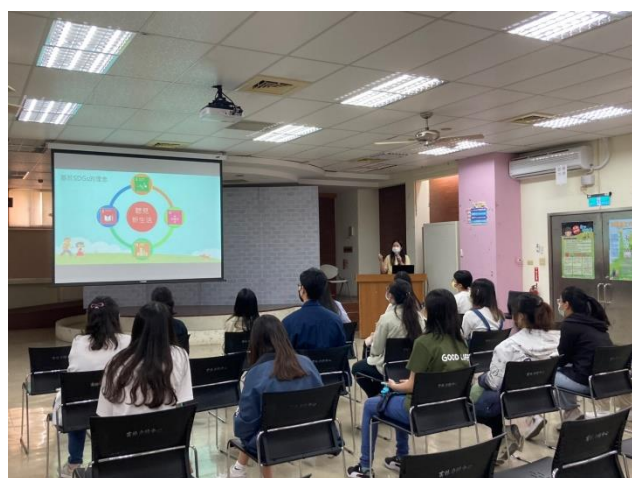
輔具中心社工介紹工作內容