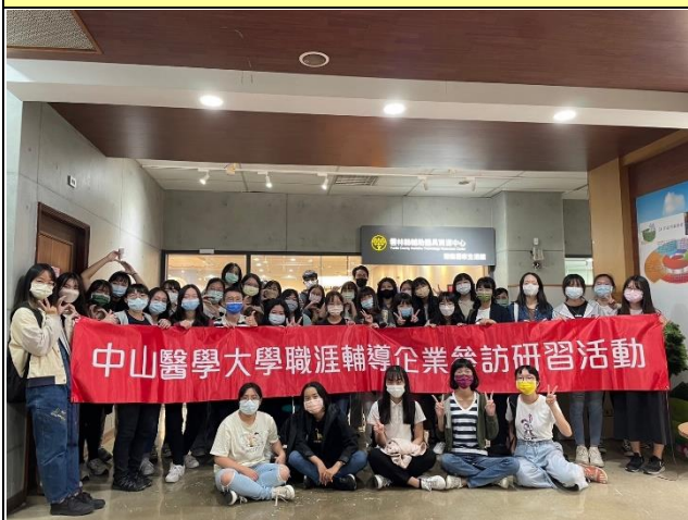
智能居家生活館門口大合照