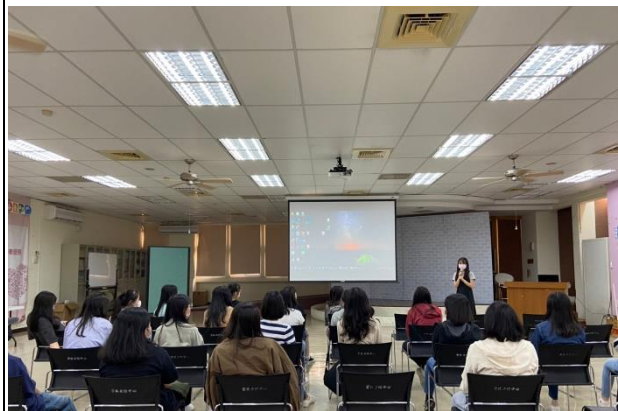
畢業系友聽力師介紹業務