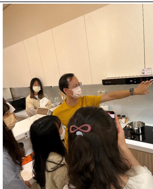
畢業系友聽力師介紹居家生活無障礙