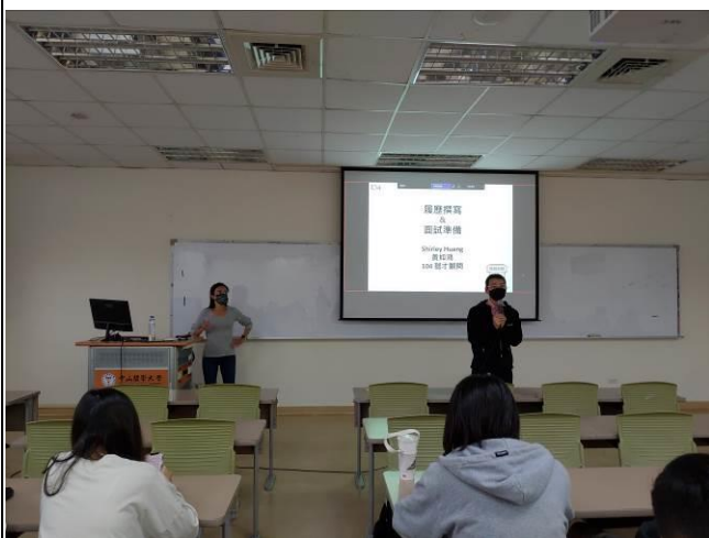
職涯輔導老師介紹講者