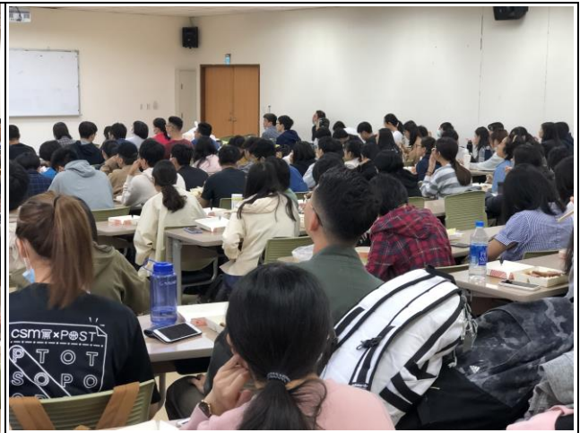
學生熱烈參與演講