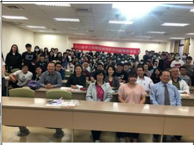
全體師生及講者大合照