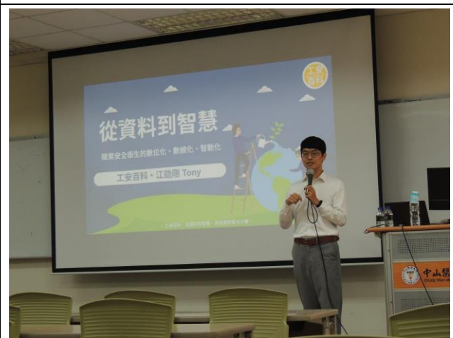
演講者的演講情形