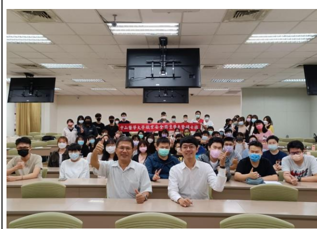
活動後語會者的合影留念