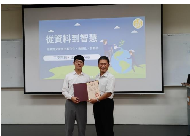
致送演講者感謝狀