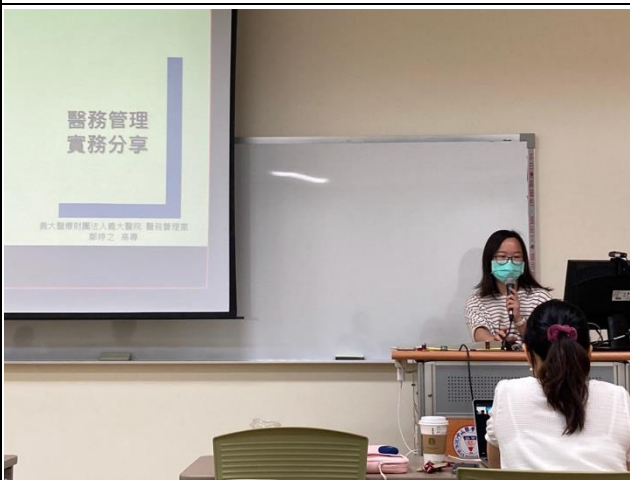
講師即將開始演講