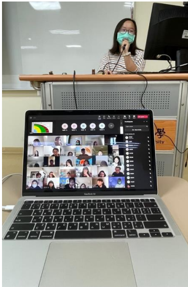
講師以及線上參與同學合影