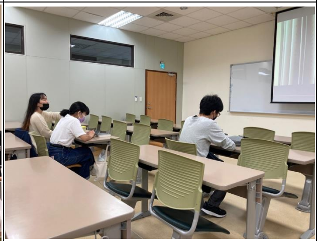
現場同學等待演講開始