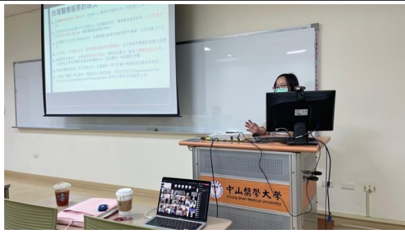
講師搭配簡報進行演講