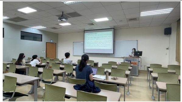
實際到場聆聽的學生