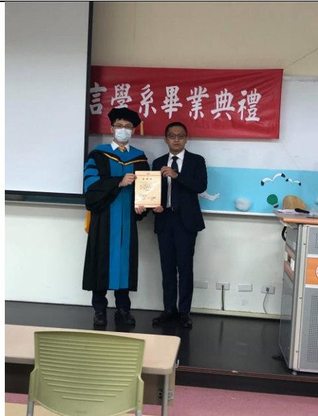
系主任頒發感謝狀