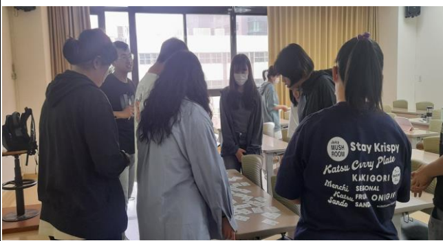
講師引導同學要抽取 FLIP 卡牌。