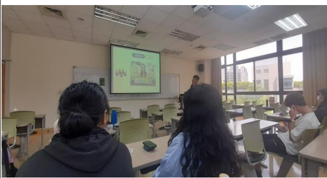
同學針對影片內容，提出一套 FLIP 法則。