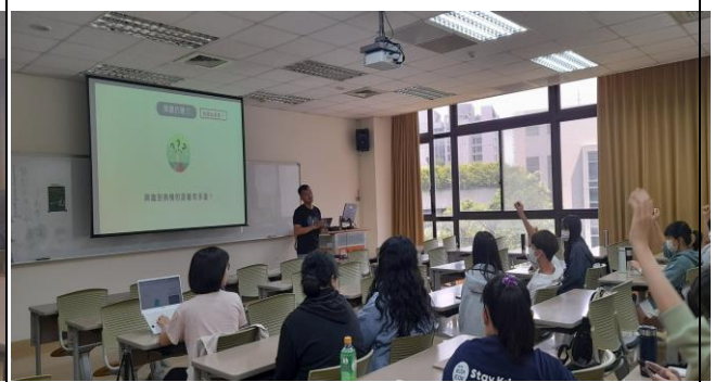
興趣到熱情的距離有多遠。