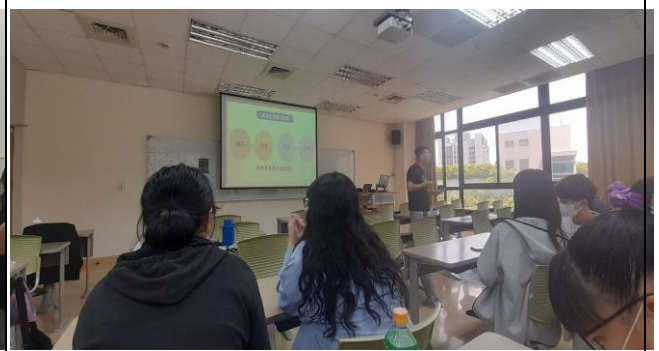
興趣如何轉化成結果。