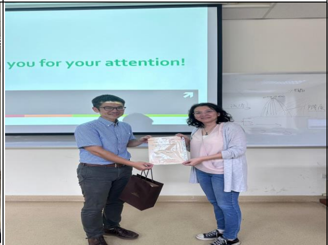
致贈感謝狀及紀念品