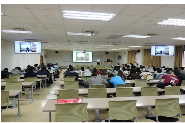
參與者認真聽講的情況