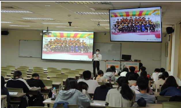
演講者介紹自己畢業的回顧