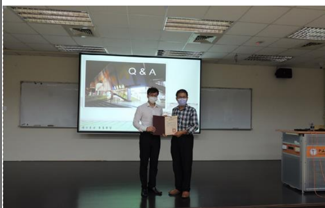
致送演講者感謝狀