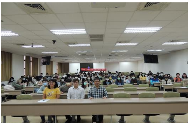
演講後與會者大合照